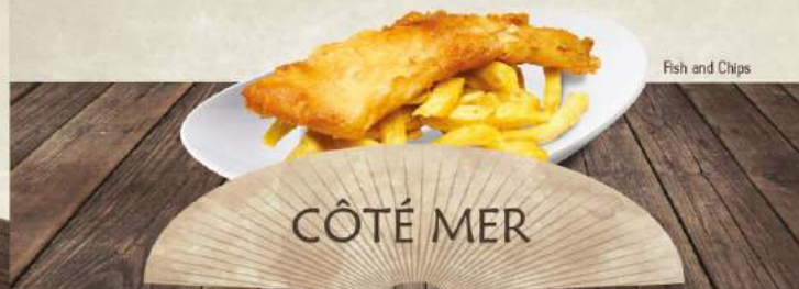
Fish and Chips

Liste des allergènes disponible sur demande. Prix nets TTC en euros - service compris Photos non contractuelles / Suggestions de présentation Les poids indiqués peuvent varier de plus ou moins 10%