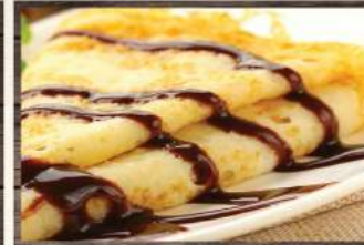
Crêpe au chocolat

Le CERZA vous offre la possibilité d'organiser vos séminaires, vos sorties CE, vos assemblées générales dans un cadre exceptionnel avec une organisation sur mesures pour les activités, les repas ou l'hébergement avec le CERZA SAFARI LODGE !