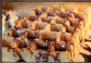
Gaufre au chocolat

La PAGODE vous accueille toute l'après-midi pour une pause sucrée !